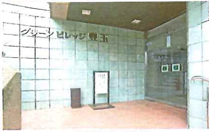
エントランス部分写真：2025年08月