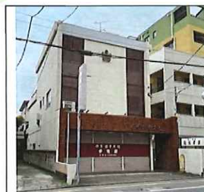
S45.11 築・RC/3階 床面積 約 8.4 坪