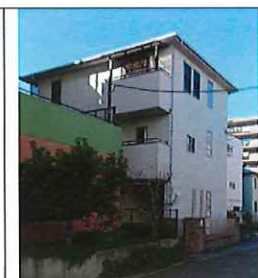
H21.3 築・木造/3階 床面積 約 4.7 坪